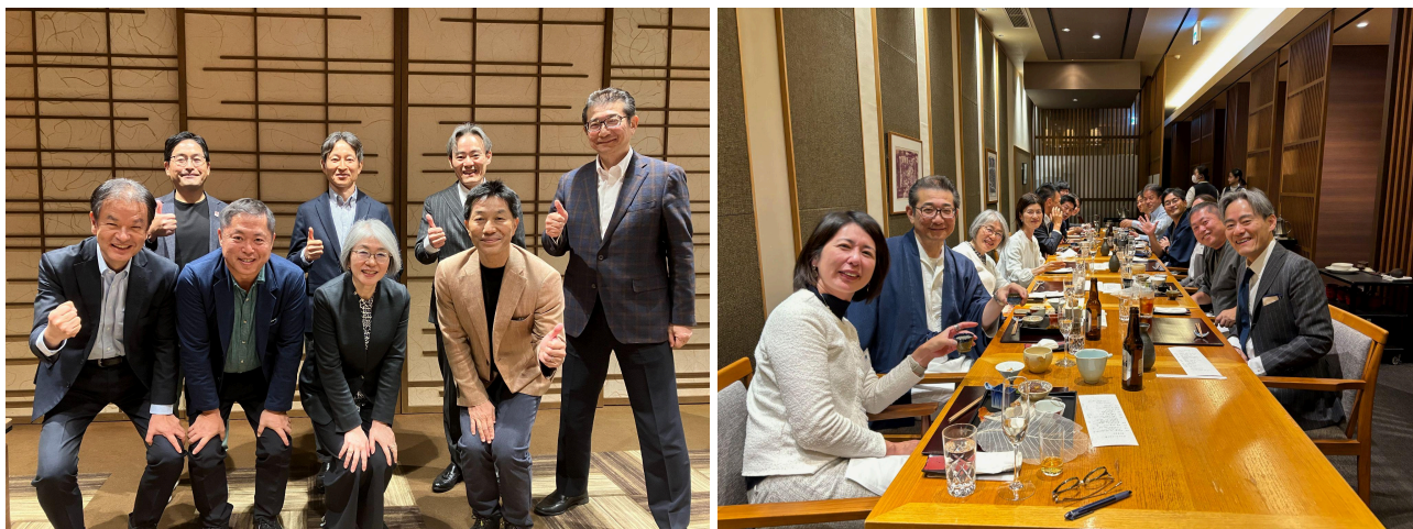
左:勉強会後の集合写真 / 右:懇親会の集合写真

また、Aoba-BBTでは、本フォーラムを一過性のイベントにとどめず、継続的な取り組みとして発展させてまいります。今後も人的資本経営や人材育成に関する各企業の実践事例や課題を共有し、普遍的な課題への対応策を探る場として、定期的にフォーラムを開催する予定です。このような情報交換と交流の機会を通じ、参加企業間でのネットワーク構築や新たな発想の創出を促進し、日本企業の競争力向上に貢献することを目指してまいります。