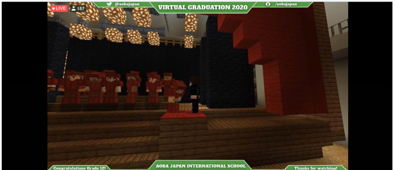
(写真 6 : 卒業証書を受け取り一礼するアバターの卒業生)

卒業式の終盤には、バーチャル空間で卒業生一人ひとりに修了証書の授与が行われました。卒業生は名前を呼ばれると、本人のアバターを操作して、ケン・セル学園長のアバターの前まで移動し、卒業証書を受け取って一礼をしました。仲間が証書を受け取る様子を、他のアバターは向きを変えたり、顔を動かしながら見守りました。