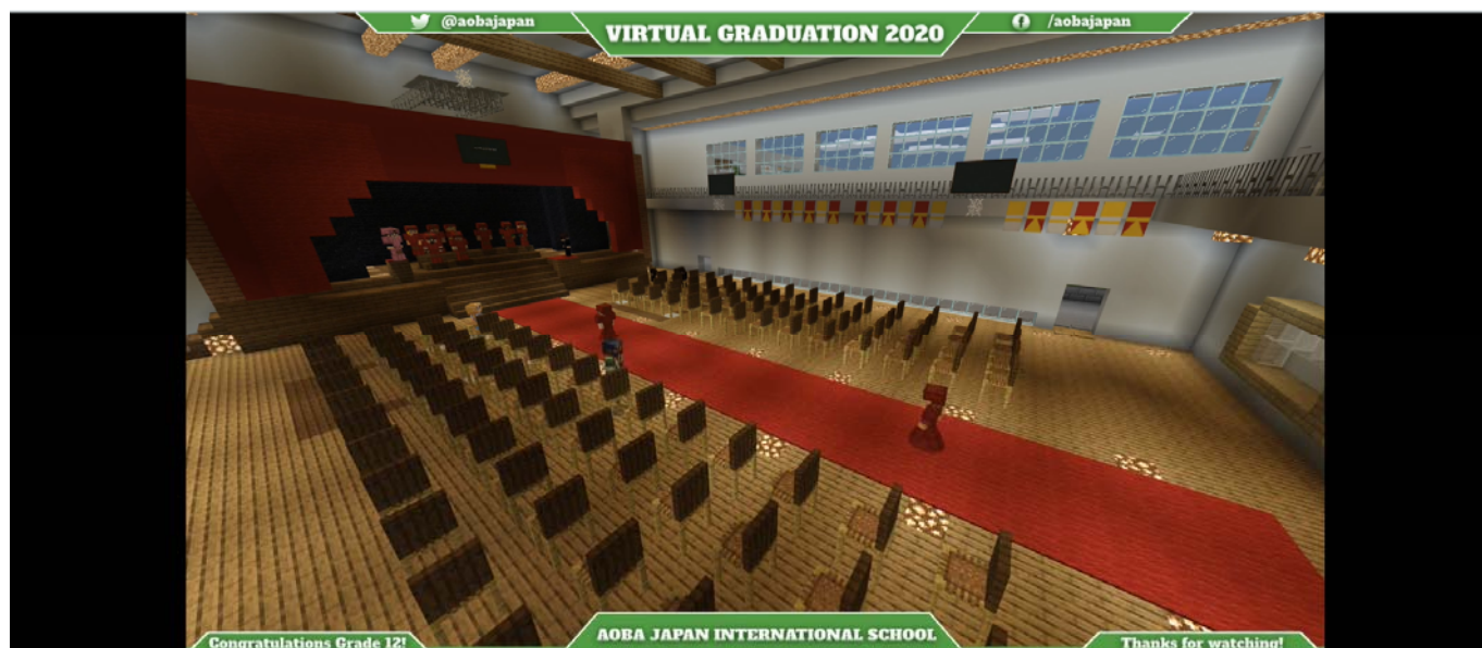
(写真 2 : 卒業生のアバターが次々と入場するシーン)

卒業式が始まると、音楽が流れ、アオバのスクールカラーであるエンジ色のガウンとハットを着た卒業生のアバターが体育館の入口から次々と入場し壇上へと上がっていきました。