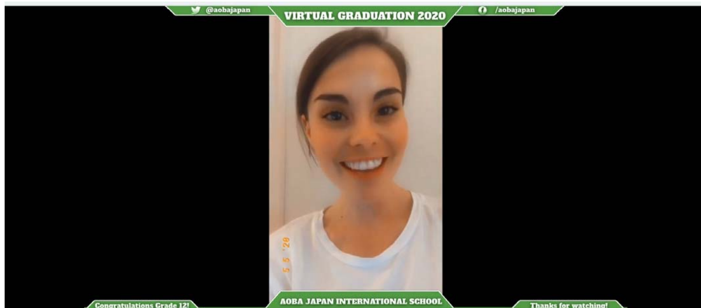
(写真 3 : 卒業生へ激励のメッセージを送る教員)

入場後には、柴田 巖（しばたいわお）理事長が卒業生への祝辞を述べたビデオメッセージが流れました。続いて在校生や教員が自宅などで撮影した激励のメッセージも流れ、卒業生のアバターはバーチャル空間でジャンプをするなどし、感激の気持ちを表しました。