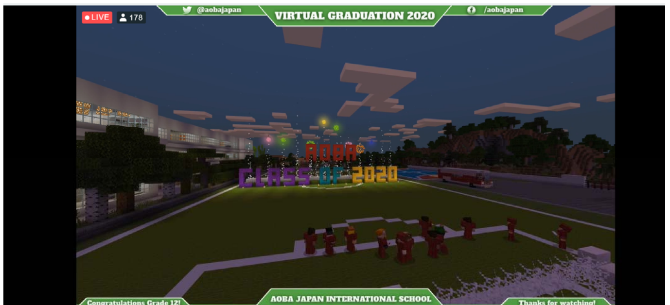
(写真 7 : 卒業式のエンディングシーン)

約 1 時間行われたバーチャル卒業式のエンディングでは、卒業生が体育館から退場してグラウンドに向い、体育館と同様にバーチャル空間で再現されたアオバのグラウンドには「AOBA CLASS OF 2020」の文字が描かれ、卒業生の門出を祝う花火が打ち上げられました。